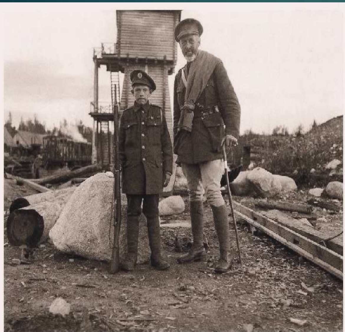
1919г. Интервенты на ст. Медвежья Гора.