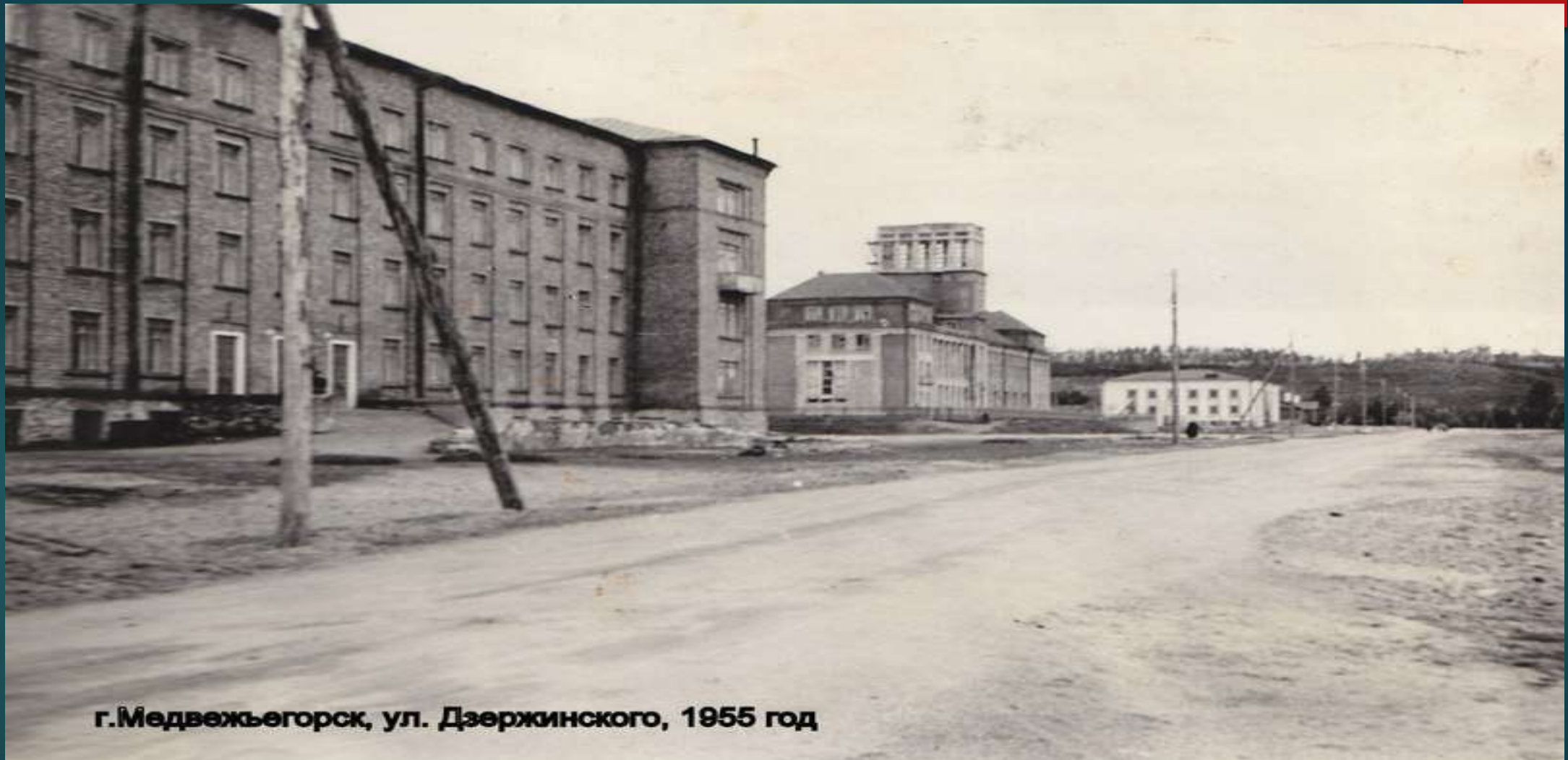
г.Медвежьегорск, ул. Дзержинского, 1955 год