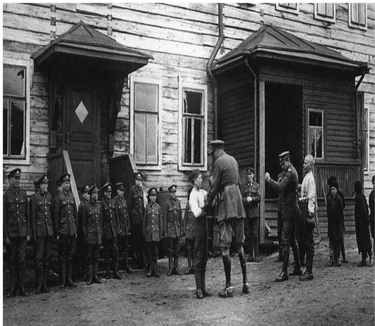
1919 год. Англичане готовят подростков к боксёрскому поединку.