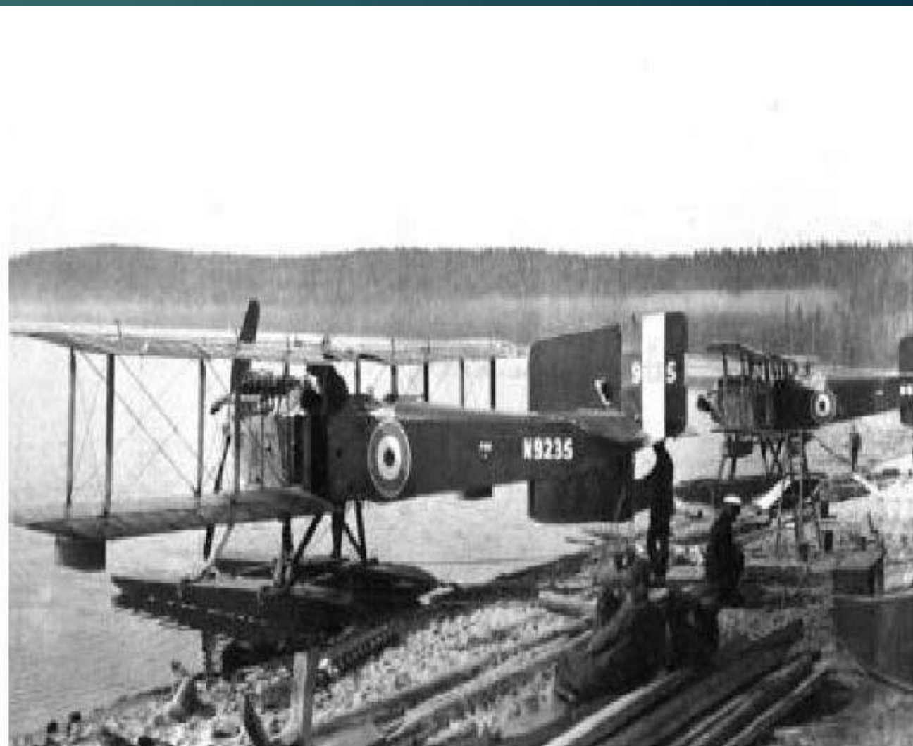
Боевые гидросамолёты интервентов в Лавас-Губе. 1919 г.