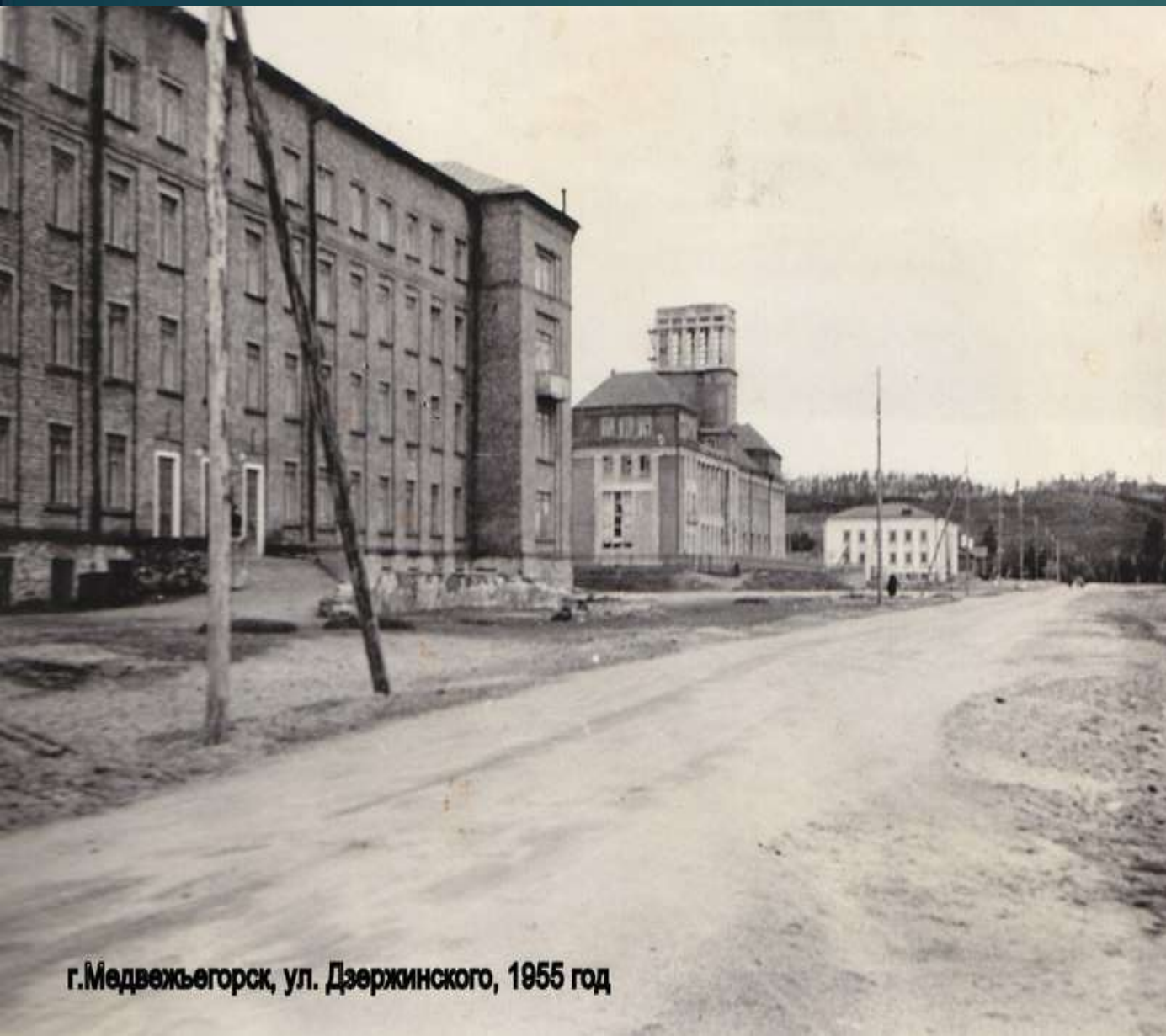
г.Медвежьегорск, ул. Дзержинского, 1955 год