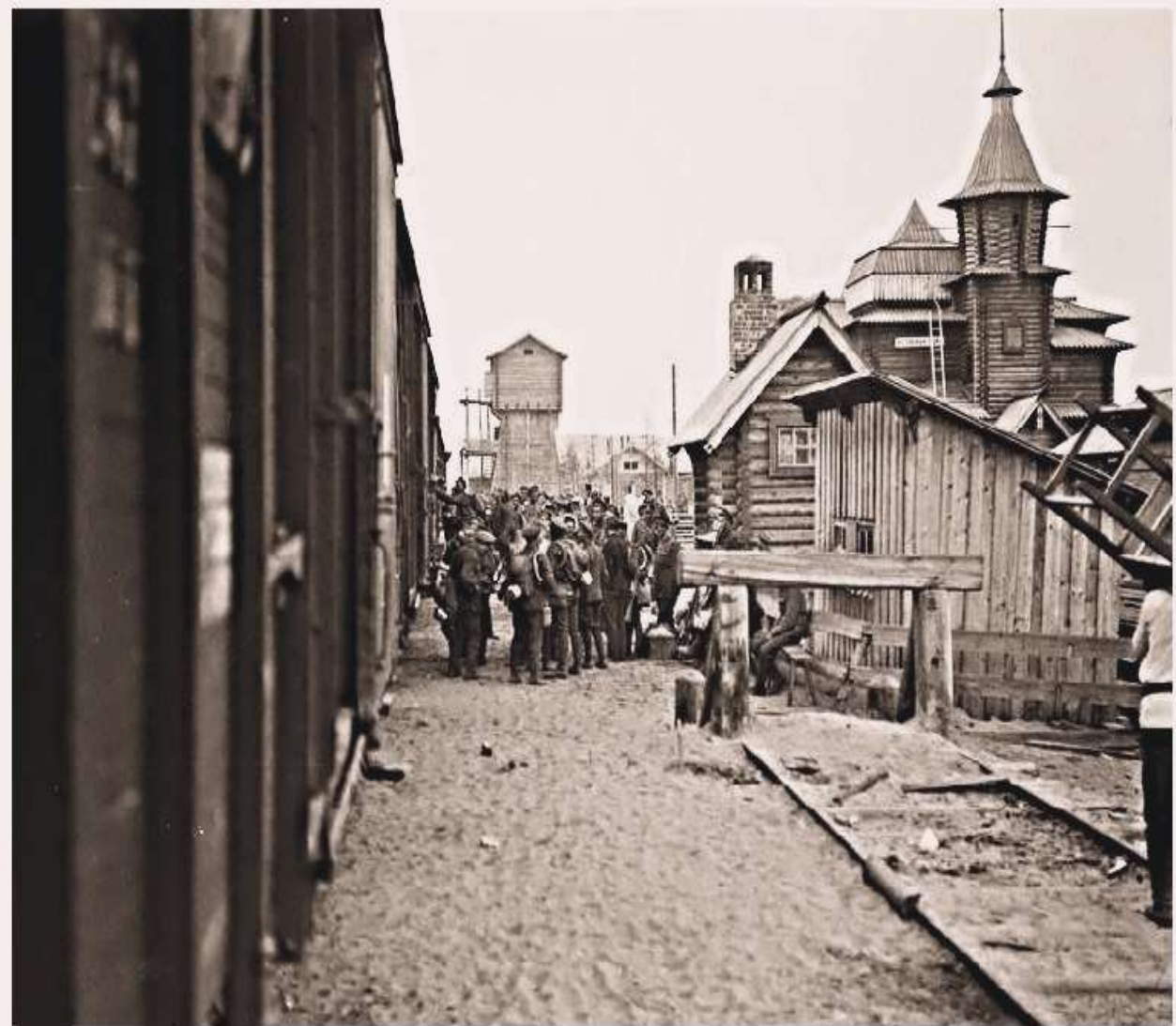
Интервенты на ст. Медвежья Гора 1919 год.