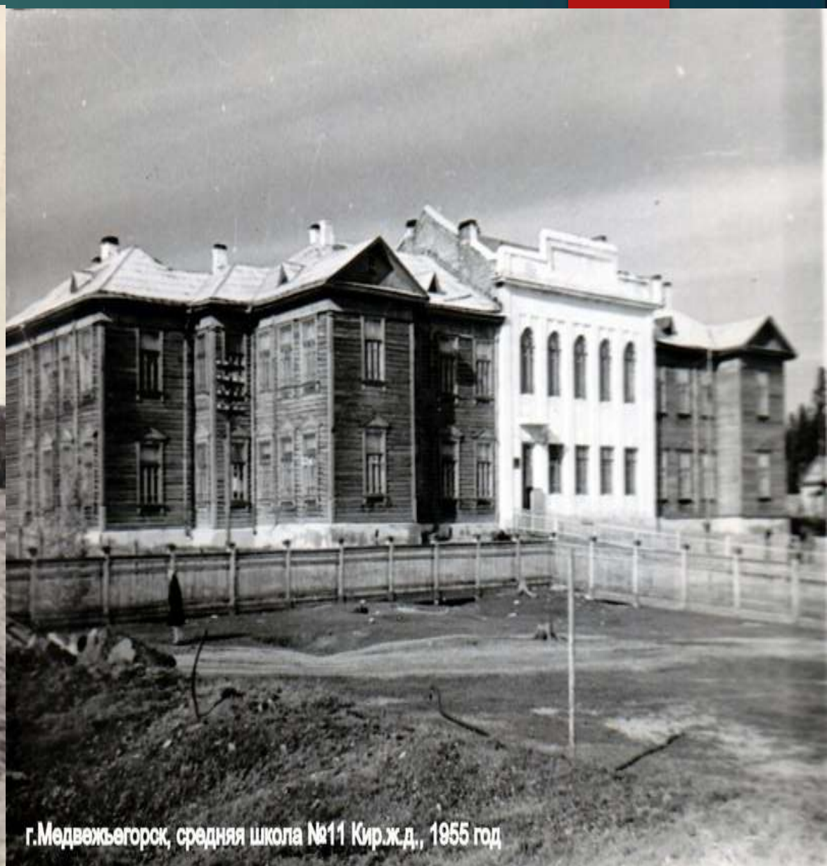
г.Медвежьегорск, средняя школа №11 Кир.ж.д., 1955 год